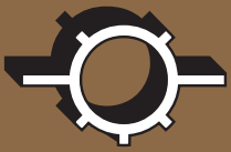
ENCOFRADO SUPERLIGERO | LIGHT RANGE | SERIE LEGERE | COFRAGEM LEVE